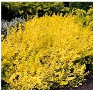
Przykładowe zdjęcie krzewuszki